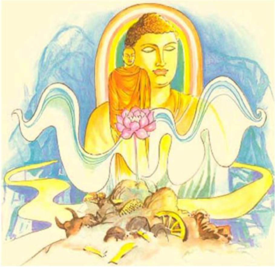
උදක් නිත්තමය පසමග තුරෙහි නිබ

කොතෙක් ගුණ කළත් දුදනන් හට අසුබ අතක් පමණුවත් නොම කෙරෙහි පිළිලබ එ උක් රසෙහි දැමුවන් නිඹ බිජු කිරබ